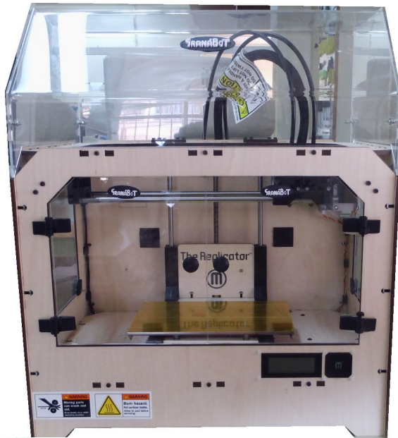
Clon #125: GrBot-3D Hijo de PLUMABOT-Gr